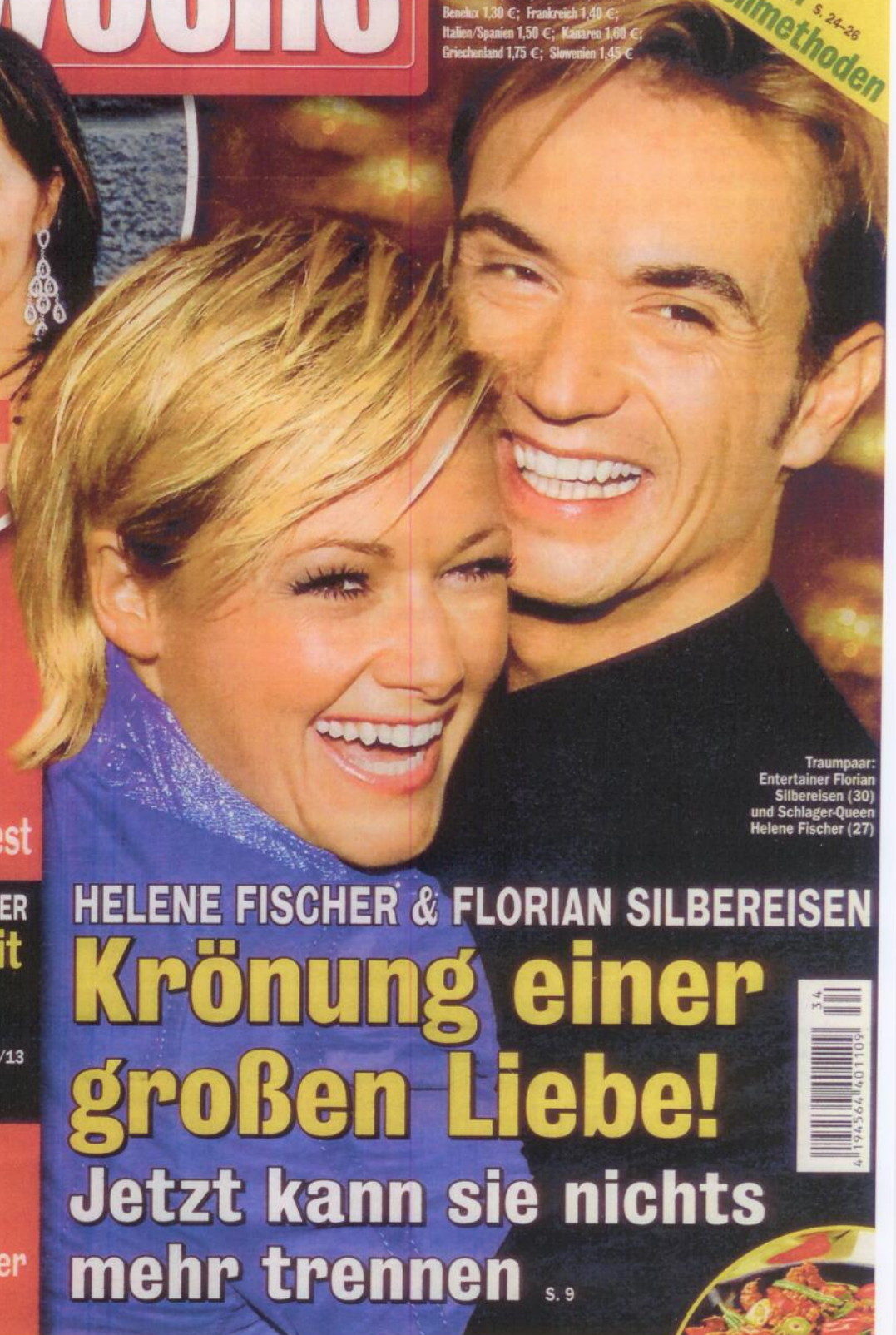
Traumpaar: Entertainer Florian Silbereisen (30) und Schlager-Queen Helene Fischer (27)

LOTHAR MATTHÄUS Hoppla! Ist der Liebes-Trottel wieder auf der Pirsch? s. 64